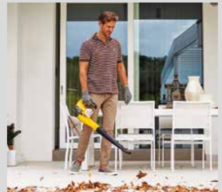
Puhallin SBL 48 AE