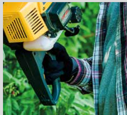
Takakahvassa olevien hallintalaitteiden ansiosta on laitteen kontrollointi helppoa.