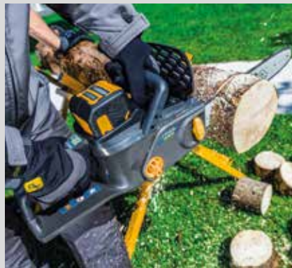
Moottorisaha SC 48 AE