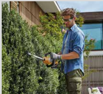
Pensasleikkuri SHT 24 AE