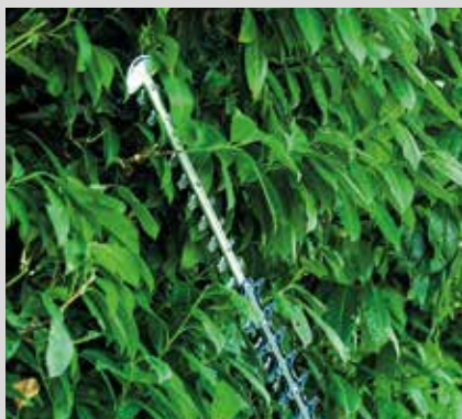
Tehokas terä leikkaa hyvin tiheitäkin pensaita.

180° kääntyvä kädensija mahdollistaa leikkaamisen pysty- ja vaakatasossa.