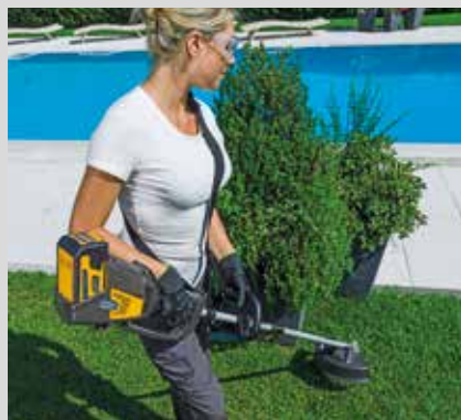
Trimmeri SBC 48 AE