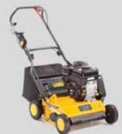
SVP 40 B