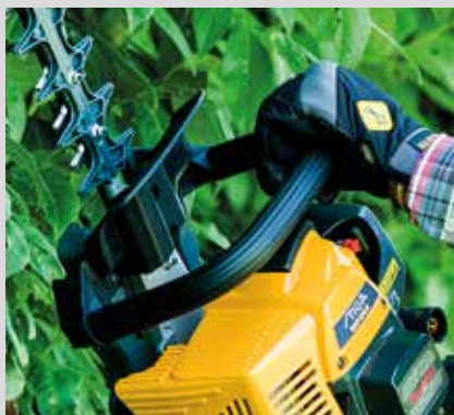
Iso etukahva mahdollistaa turvallisen työskentelyn mukavassa asennossa.