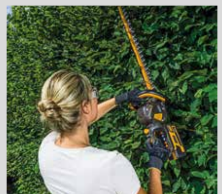
Pensasleikkuri SHT 48 E