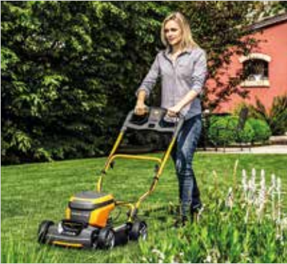
Multiclip 47 AE ja 47 S AE, Combi 50 S AE