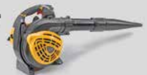
SBL 327 V