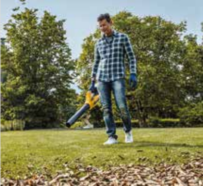
Puhallin SAB 80 AE