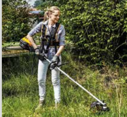
Trimmerit SBC 80 AE ja 80 D AE