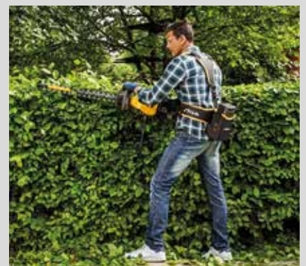
Pensasleikkuri SHT 80 E