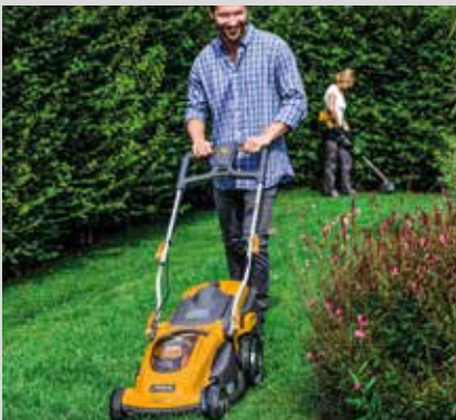
Ruohonleikkuri Combi 36 AE ja Combi 40 AE