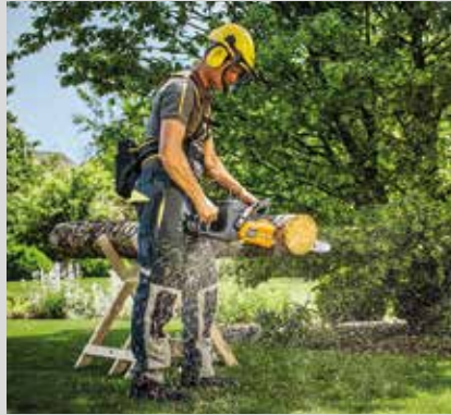
Moottorisaha SC 80 AE