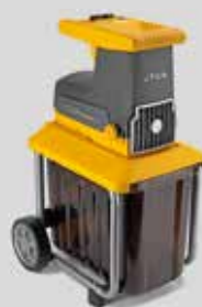
BIO MASTER 2200