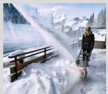
Lumilinko ST 4851 AE