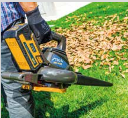
Puhallin/imuri SBV 48 AE