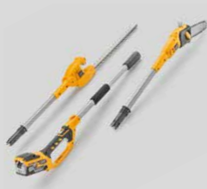
Monitoimityökalu SMT 24 AE