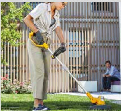
Trimmeri SGT 24 AE