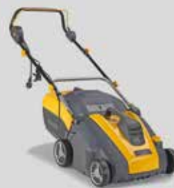
SV 415 E