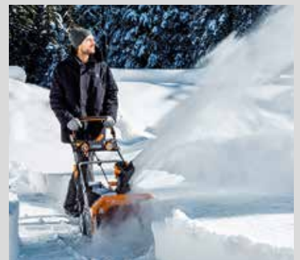
Lumilinko ST 8051 AE

Saman akun käyttäminen eri työvälineissä on akkuvaljaiden ansiosta erittäin helppoa. Voit myös työskennellä käsityökaluilla pidempiä työjaksoja käyttämällä niissä 4,0 tai 5,0 Ah akkuja.