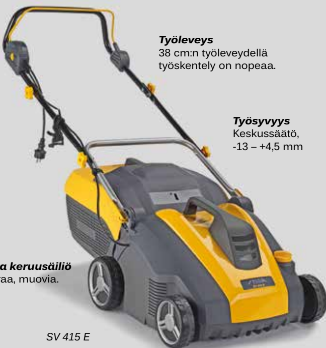
SV 415 E