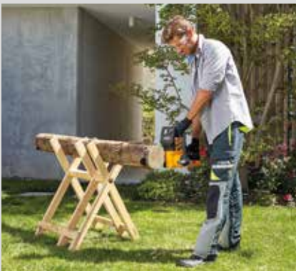
Moottorisaha SC 24 AE

Voit nauttia täydellisestä vapaudesta, ilman tielläolevia johtoja, kun käytät näitä kevyitä työvälineitä, jotka on varustettu 24V uudelleenladattavavilla akuilla. Tuotepereeseen kuuluu puhallin, pensasleikkuri, trimmeri, moottorisaha sekä monitoimityökalu. Hanki yksi, tai useampi, riippuen siitä minkälaista huolenpitoa oma vihreä keitaasi tarvitsee. Niiden kompaktin koon sekä polttoaineettomuuden ansiosta ne säästävät aikaasi ja tilaasi.